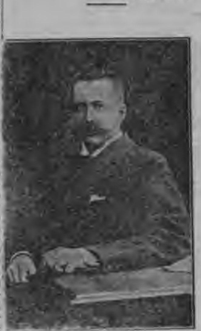
Кн. В. М. Волконский.

В Рижском направлении происходят серьезные боевые действия. Наши войска активно ведут наступательные операции, стремясь расширить фронт.